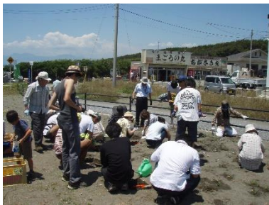
植栽会の様子(イメージ)

神奈川県における「SAVE JAPAN プロジェクト 2016-2017」（※下記参照）では、認定特定非営利法人ゆい、認定特定非営利法人藤沢市市民活動推進連絡会、認定特定非営利法人日本NPOセンター、損害保険ジャパン日本興亜株式会社の4者が協力し、湘南海岸に砂草の植栽や外来種の駆除を実施いたします。第1回の活動として、2016年10月22日(土)に茅ヶ崎市東海岸にて「神奈川県の絶滅危惧種ビロードテンツキ植栽会」を開催し、一般市民の皆さまが参加、保護活動の体験を通して地域の自然環境への関心が向上することを期待します。