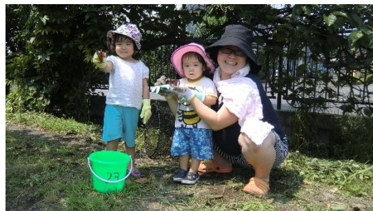
外来種(アメリカザリガニ)の駆除