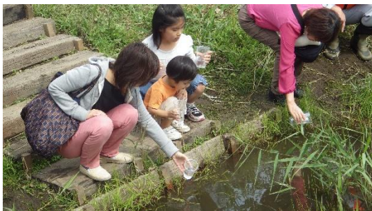
希少種の保護活動(藤沢メダカの放流)