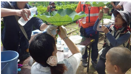
地域の自然と触れ合う活動(はすの味を楽しむ)