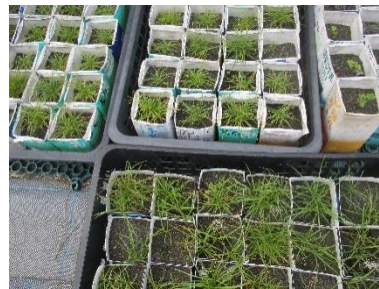
ビロードテンツキの苗